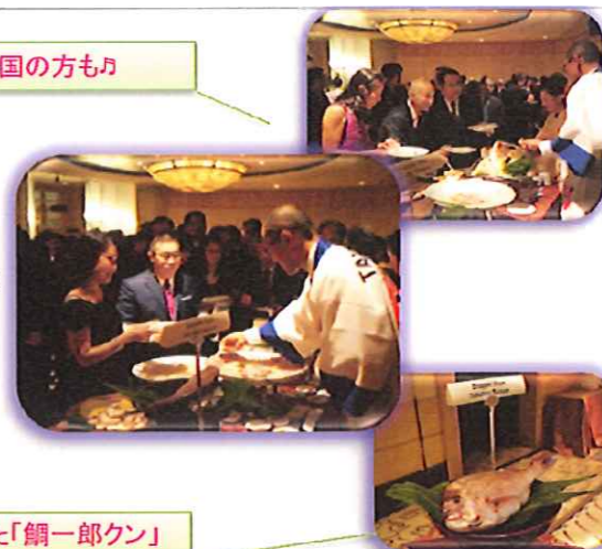
シンガポールで食べて頂いた「鯛一郎クン」