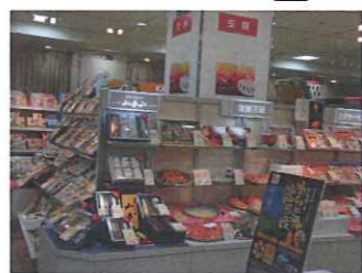
東京日本橋の高島屋さんに展示されていました。

今年のお歳暮商品として全国の高島屋さんで鯛一郎クンの鯛の半身姿干しを取り扱って頂き大変ご好評をいただきました! インターネットでも「高島屋」「愛媛」「たいの半身姿干し」で検索していただくとショッピングサイトでご購入も出来ます! 鯛一郎クンの姿干しは、お頭付きで切り身になっています。鯛は縁起物で目出度い贈り物です。大切な方に喜んで頂ける商品となっておりますので、どうぞよろしくお祈りいたします<m(_)_m> <アイシャドー>