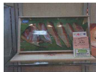
縁起の良い送りものとして、好評です。