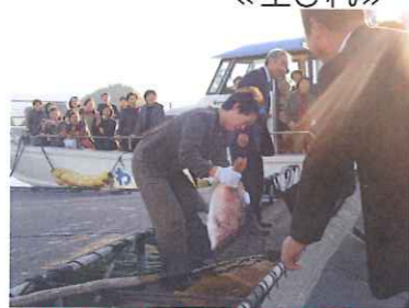
鯛を釣り上げると、大歓声が上がった!!!