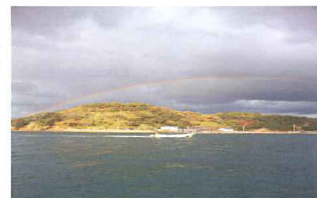
<尾ひれ> 虹がかかった時の写真 幻想的で美しかった!

12/17 水温17.0℃ 酸素6.3ppm 寒い{(>_<)} 本格的に冬到来!! 着る服も増え、ズボンも増え、靴下も増え、こんな格好で動けるのかよと言うくらいの厚着! (笑) これが冬になって、まず悩まされる所です(^_^) 12月になり皆様がバタバタ仕事をされている様に、海もバタバタ大暴れです(笑) 時化なんです! 今年は去年より寒くなるみたいなので覚悟をしなければなりません! 今年は雪降るなよ! と、願う今日この頃です(*_*) 海の様子じゃなく、今回は尾ひれの独り言ですf_笑