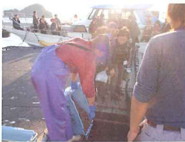
鯛の餌やり体験中の皆さん

JA愛媛南さんと姉妹提携している宮城のJA栗っこの女性部の方々が養殖見学に来られました♪♪遊子の段々畑を見学された後、渡船で34名の方々が鯛一郎クン養殖筏に大集合(≧▽≦)過去最高人数に驚きましたが、皆さんは餌やりを初めて見たらしく、すごい歓声でした(*^o^*)その後の、鯛を釣ってもらった時の大歓声は、僕らのテンションを跳ね上げるくらいすごいものでした!皆さんに、とても喜んでもらえてよかったですV(^-^)^釣上げた鯛は、宇和島のかどやさんに持ち込みして鯛料理を満喫して頂きたいです♪こんなに喜んでくれる姿を目の当たりにすると、やりがいのある仕事だなあとあらためて感じさせられます。 <左ひれ>